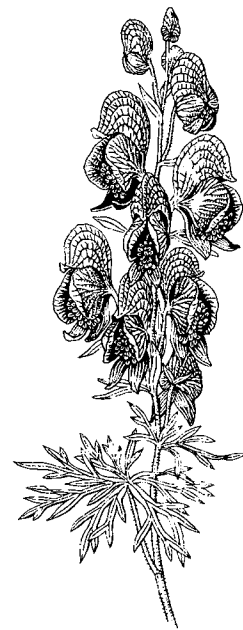
Aconitum napellus - Eisenhut